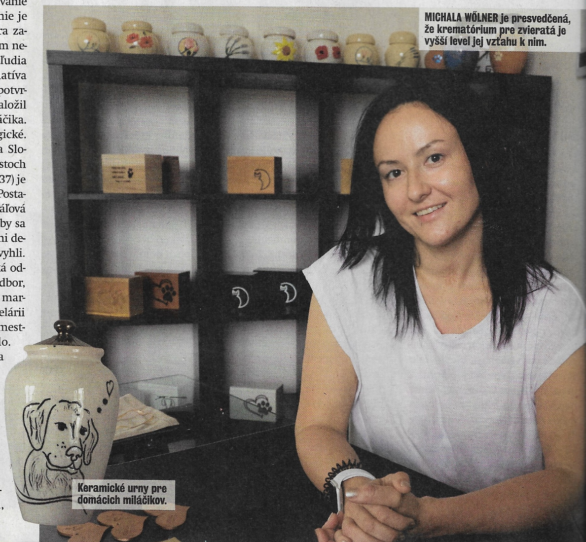
Keramické urny pre domácich miláčikov.