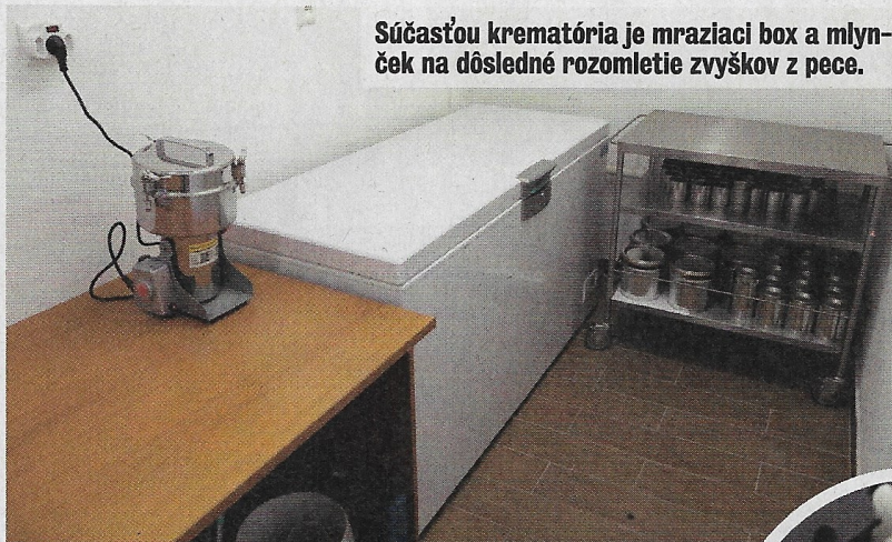
Súčasťou krematória je mraziaci box a mlynček na dôsledné rozomletie zvyškov z pece.