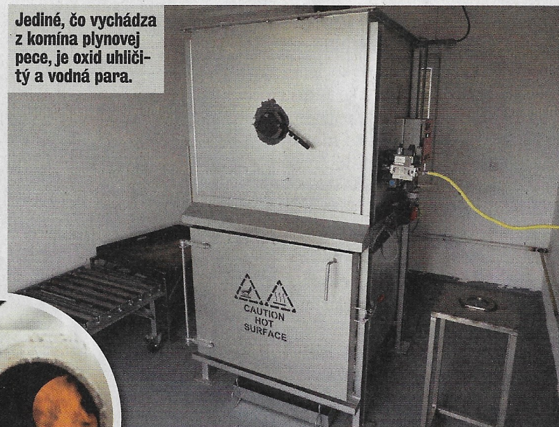
Jediné, čo vychádza z komína plynovej pece, je oxid uhličitý a vodná para.