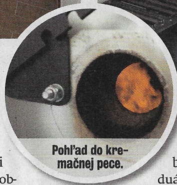
Pohľad do kremečnej pece.

mesiac, kým sa ľudia dostali k popolu svojich zvieratiek. Chceli sme im pomôcť. Budovu, v ktorej je kremečná pec, sme kúpili dávnejšie. Dom uprostred poľí ani z dialky, ani zblízka krematórium nepripomína. Je dva kilometre za dedinou a nemá žiadnych susedov. Zdalo by