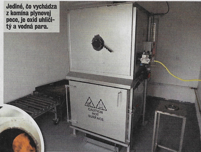
Jediné, čo vychádza z komína plynovej pece, je oxid uhličitý a vodná para.