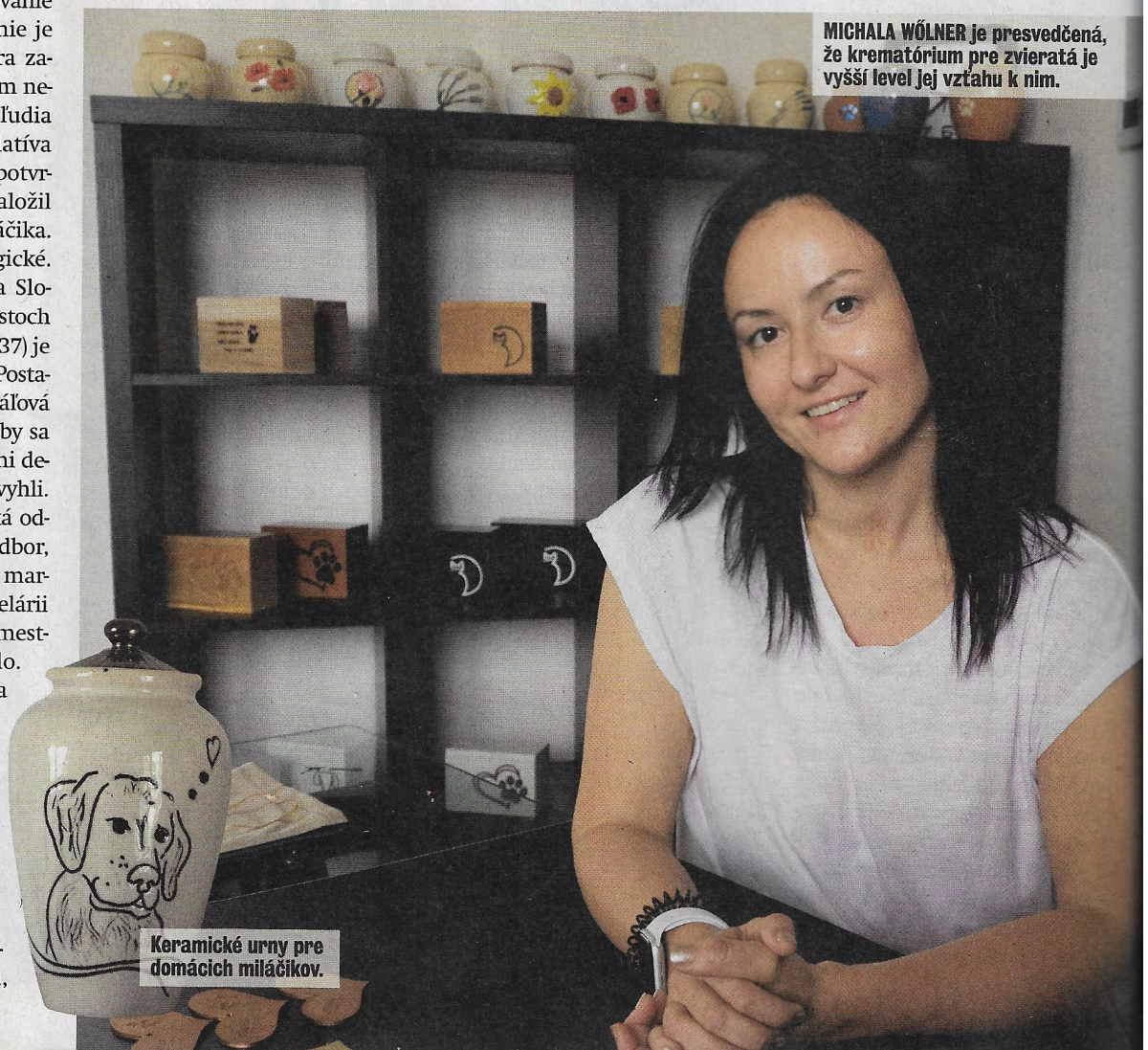
Keramické urny pre domácich miláčikov.