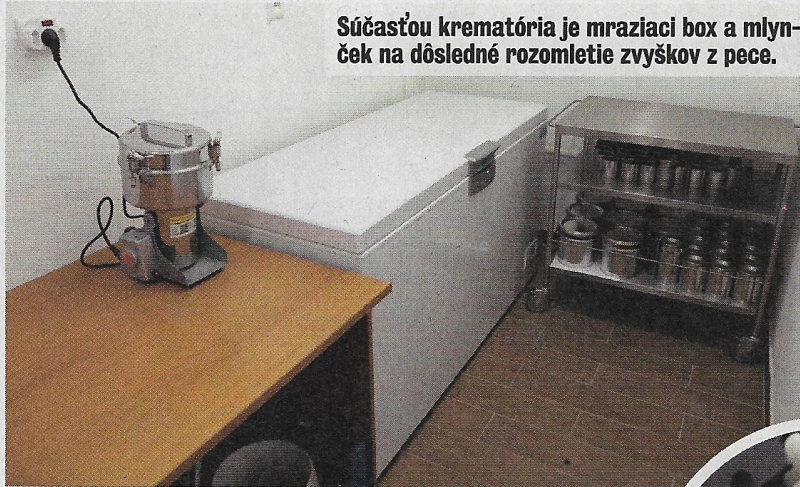
Súčasťou krematória je mraziaci box a mlynček na dôsledné rozomletie zvyškov z pece.