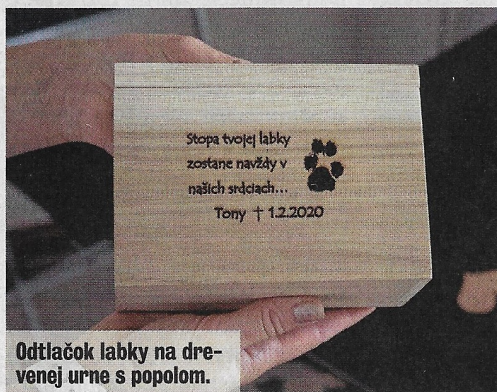
Odtlačok labky na drevenej urne s popolom.

V kafilérii to nie je možné. Tam to nie je likvidácia, ale spracovanie. Používajú vysoký tlak a vyššie teploty. Do jednej várky ide naraz veľké množstvo tiel rôznych zvierat, ošípaných, hovädzieho dobytku, pokazené mäso zo supermarketov, psy, mačky, zrazené zvieratá... Majiteľ sa nikdy nedostane k popolu svojho zvieratka. O dôstojnosti sa nedá ani hovoriť,“ vysvetľuje konateľka.