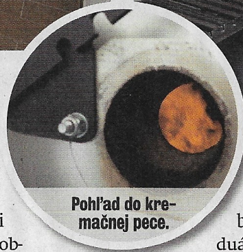
Pohľad do kremáčnej pece.

mesiac, kým sa ľudia dostali k popolu svojich zvieratiek. Chceli sme im pomôcť. Budovu, v ktorej je kremáčna pec, sme kúpili dávnejšie. Dom uprostred polí ani z dialky, ani zblízka krematórium nepripomína. Je dva kilometre za dedinou a nemá žiadnych susedov. Zdalo by